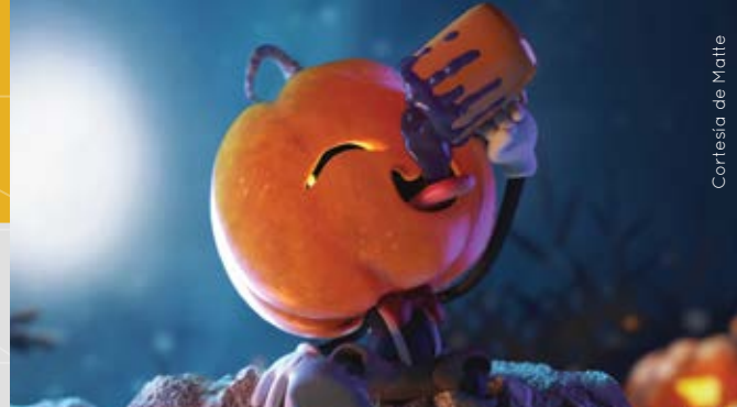
Cortesía de Matte